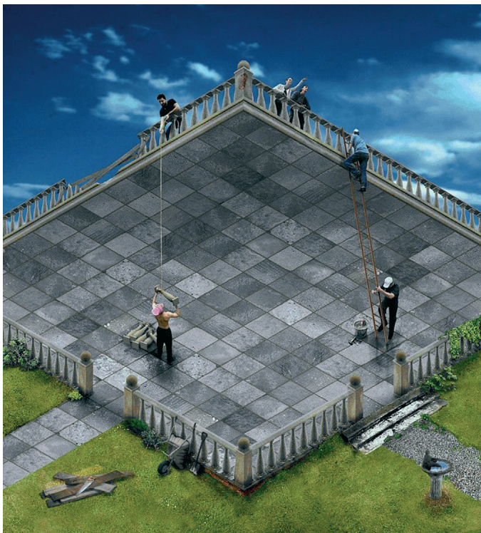
Abb. 1: Illusion oder Wirklichkeit? – Nicht immer fällt die Entscheidung leicht. Die Natur konfrontiert uns stets aufs Neue mit irrational erscheinenden Vorgängen. Nicht selten bedarf es jahrelanger Forschung, um die Phänomene zu entzaubern.

erscheinende Vorgänge vorstellen. Meist hat es die Astrophysiker viel Mühe gekostet, zu verstehen, was sich da tut. Nicht immer ist alles klar. Noch immer bedürfen viele Theorien einer Bestätigung durch Experiment oder Beobachtung. Der Faszination tut das jedoch keinen Abbruch (Abb. 1).