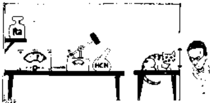
Das Experiment mit Schrödingers Katze.

Die Gefahr im Kasten droht, weil dort ein Giftgas auf den Zufall wartet, der es freisetzt; und die Gefahr in den Köpfen droht, weil Schrödingers Katze eine Theorie der atomaren Natur veranschaulichen soll, die nicht nur im eingeschränkt wissenschaftlichen, sondern selbst im global ökonomischen Bereich extrem erfolgreich ist, von der aber zugleich auch gesagt wird, dass nur derjenige sie wirklich verstanden hat, der dabei wenigstens ein wenig verrückt geworden ist.