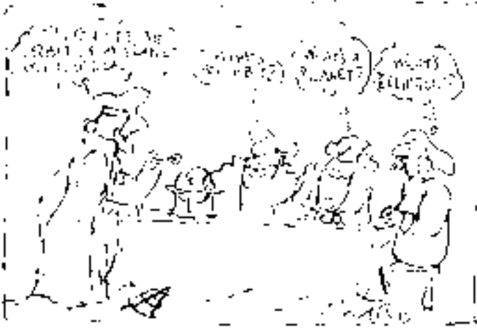
Johannes Keplers »Uphill battle«.

Umgang haben und mit denen wir uns erst vertraut machen müssen.