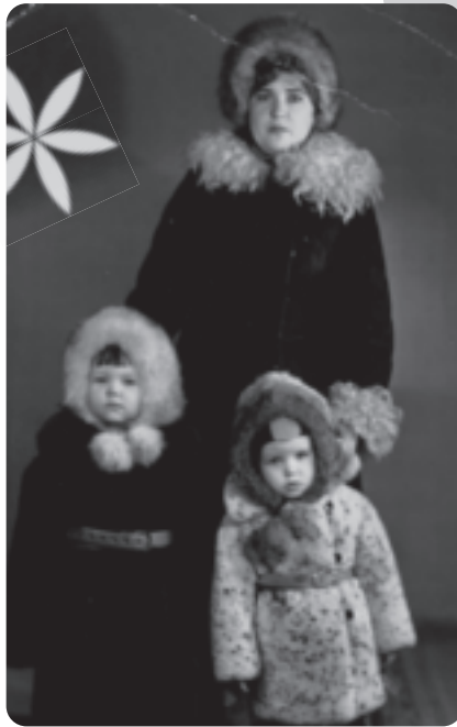
Mit meinem Bruder und meiner Mutter im Fotostudio – in dicker Winterkleidung.