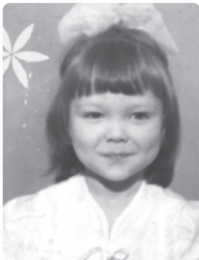
Als Kind war ich meist sehr ernst. Ich hatte so viele Fragen.

Güte entschieden und dies ihr Leben lang so beibehalten. Ganz gleich, wie unmenschlich sich manche in ihrem Umfeld auch benommen haben, sie hat nie ein böses Wort verloren, niemals jemanden bewertet. Ich glaube, das ist die wahre Engelsstärke: nicht zu bewerten, sondern in tiefster Güte Verständnis aufzubringen und liebevoll zu handeln. Eine solche Kraft in einem einzigen Menschen reicht für viele. Und sie zog sich, wenn ich heute zurückschaue, wie ein schmaler, aber spürbarer roter Faden durch die Jahre meiner Kindheit. Oder vielleicht sollte ich eher sagen: wie ein goldener Faden durch eine ansonsten recht düstere und schwere Welt.