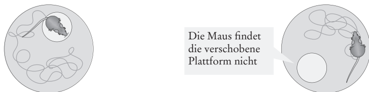
Abb. 1.2B Ist die Neurogenese gehemmt, findet die Maus im ersten Versuch ebenfalls die Plattform. Sie scheitert erst, wenn die Plattform danach stillschweigend verschoben wurde: Die Maus sucht und sucht an der alten Stelle. Es ist, als könnte die Maus die unbrauchbar gewordene Erinnerung an die frühere Position der Plattform nicht vergessen. Sie schafft es nicht, sich von ihrem alten Gedächtnisinhalt (im weiteren Sinne: von der Vorstellung, die sie sich von der Welt gemacht hat) zu lösen. Ohne Nachschub neuer Nervenzellen im Hippocampus wird das Verhalten der Maus unflexibel und »starr«. 17

Seepferdchen in unserem Kopf auf Trab bringen, die Neurogenese anregen und uns so auch vor der geistigen Versteinerung und dem allzu ausufernden Grübeln schützen. Da den Hippocampus zu stärken zugleich heißt, die Stressresilienz zu stärken, könnte eine gesunde Ernährung darüber hinaus dabei helfen, den üblichen Alltags-