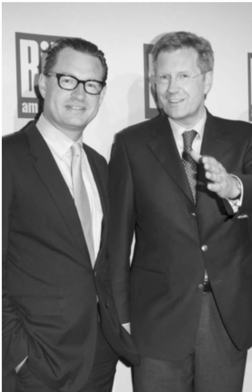
Da war die Welt noch in Ordnung: Mit dem damaligen niedersächsischen Ministerpräsidenten Christian Wulff beim BILD-Sommerfest 2008