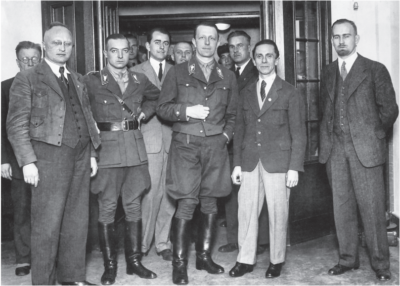
Umbau-Architekt im Parteidienst: Speer mit seinem Förderer Karl Hanke (rechts), dem Berliner Gauleiter Joseph Goebbels und Parteifreunden 1932 anlässlich des von Speer geleiteten Umbaus des Berliner Gauhauses in der Voßstraße 11. Sechs Jahre später ließ Speer das Haus abreißen, um Platz zu schaffen für die Neue Reichskanzlei.

so bedeutete dies vor allem: Speer war schon im Sommer 1932 ein so selbstverständlicher Teil des zentralen Berliner NS-Zirkels, dass er von Hanke, der im November in den Reichstag gewählt wurde, direkt einbezogen und versorgt wurde sowie mehrfach den prominenten Berliner Gauleiter und Propagandachef der Partei traf.