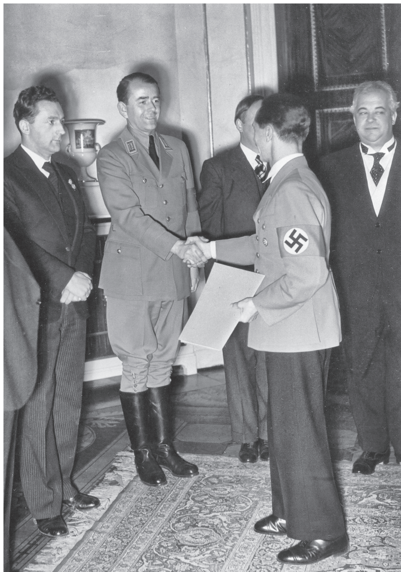
»Professor« in Uniform: Speer nimmt am 30. Januar 1937 als strammer Parteimann seine Urkunde zum Professorentitel aus der Hand von Propagandaminister Goebbels in Empfang. Das Regime feierte den vierten Jahrestag der »Machtergreifung« und »Professor« Speer wurde am selben Tag zum »Generalbauinspektor für die Reichshauptstadt«.