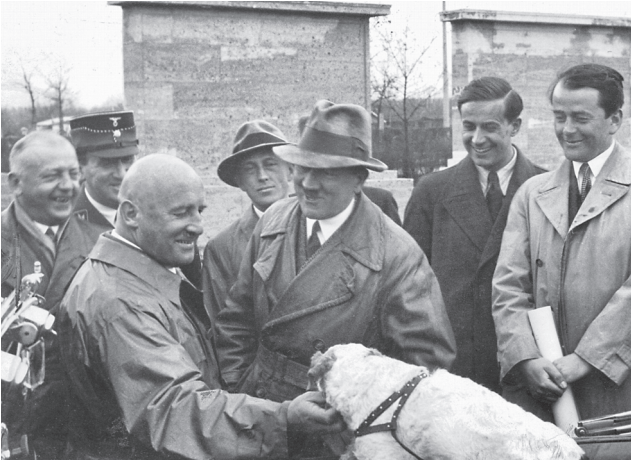
Vertraute Nazis: Julius Streicher beim Plausch mit seinem Duz-Freund Hitler, daneben Karl Brandt, ab 1939 mit den Euthanasie-morden beauftragt, und Albert Speer, der den Rassegedanken in Stein errichten und später die notwendigen Waffen schmieden sollte.