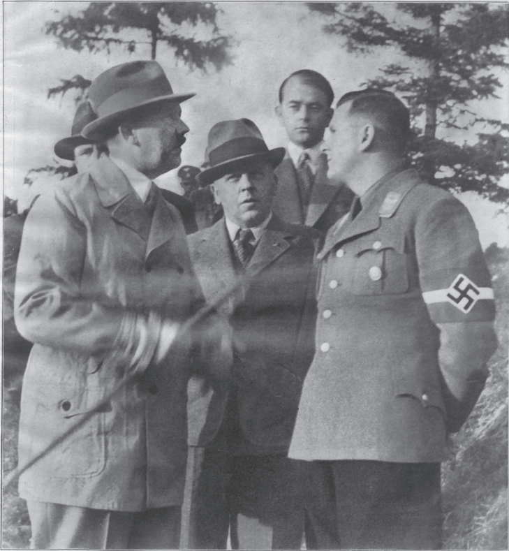
Vorweihnachtsstube auf dem Oberjalsberg bei Berchtesgaden. Der Führer im Gespräch mit Reichsleiter Max Amann und Reichsingenieur Baldur v. Schirach. Hinterer Reichsleiter Bormann und der Stabschef der Reichsparteitage Albert Speer.

VERLAG FRANZ EHER NACHF. & CO. MÜNCHEN 2 NO