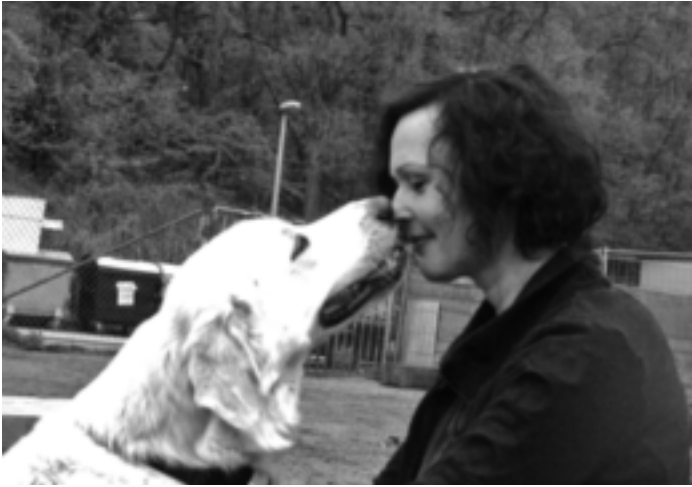
Raida und Maja beim Kennenlernen im Tierheim Koblenz

Wie von selbst rutsche ich in die Hocke und möchte dem Hund jetzt einfach nur nahe sein, ohne etwas mit ihm zu leisten.